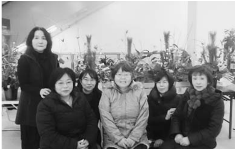
先生の指導で豪華に仕上がる

全建総連会津主婦の会では2017年12月26日(火)にお正月用の生花教室を「フラワーショップゆき」に於いて7名の参加者で開催しました。去年同様、剣山は使用せず、器にスポンジを敷き詰めて、先手が準備してくれ、松・ユリ・チューリップなどのお花を順番にさしていきました。先生の方で7名分同じ器が準備出来ず中には、大きめのどんぶり型の器があり、仕上がりはそのままの器なのかなあと思っていましたが、最後の仕上げに、先生がきれいな紙で、どんぶりを包んで