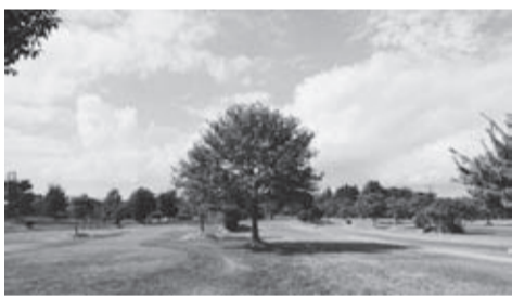
緑に囲まれた広大なコースでプレー

10月16日、飯坂出張所は相馬市「相馬光陽パークゴルフ場」で健康体力づくり教室を開催しました。28人が参加しました。爽やかな秋晴れに恵まれ、午前中に18ホール、昼食は、お食事処「たこ八」