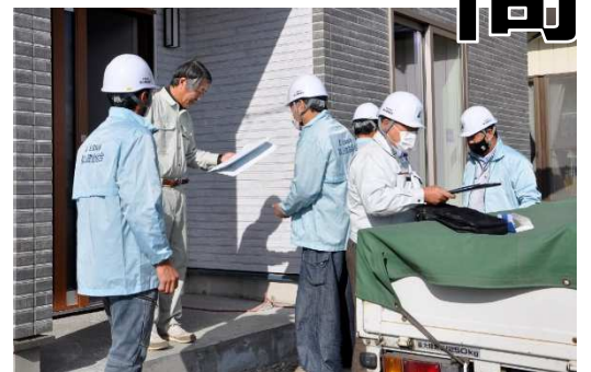
揃いのジャンパーを着て現場で組合をPR

「安全パトロールで現場を見てまわり、共通で感じた事は、いずれも作業環境が綺麗だった事です。土木業の私は足場の知識などは無く全くの素人ですが、現場では一人一人が仕事をしやすくする環境を作る事が、最終的には自身の安全に繋がると改めて確信出来たパトロールとなりました。」