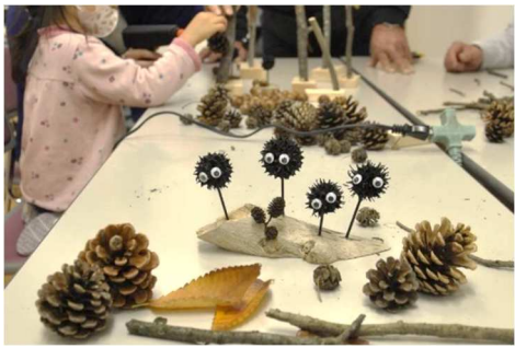
モミジバフウの実がまっくろくろすけ風に