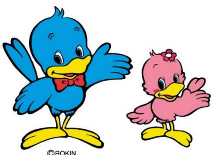
ろうきんのマスコットキャラクター ロッキー&ピンキー

郡山建設組合が会員になつている東北労働金庫(略称「ろうきん」と組合員の取り引きのメリットについてシリーズで紹介いたします。